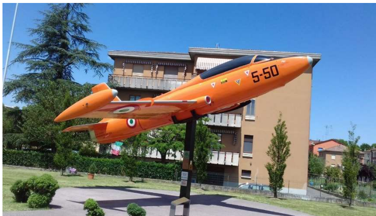
(nella foto lo splendido colpo d'occhio del largo degli Aviatori a Fidenza)

La presenza di questo enorme "monumento aereo" che suscita curiosità nei passanti e interesse degli appassionati di aviazione, ha ispirato anche il nome al luogo dove è esposto, che nella toponomastica fidentina è diventato "Largo degli Aviatori".